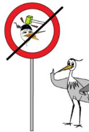
houd het fijn, doe elkaar geen pijn!