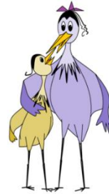
groot en klein: 'eerlijk zijn'!