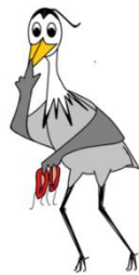
rust: een 'must'!