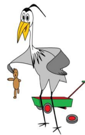
houd je spullen oké, een ander wil er ook mee!